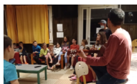
MUSIQUE À HJS ON APPREND AUSSI À JOUER D'UN INSTRUMENT