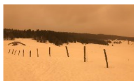
MÉTÉOROLOGIE LA NEIGE DU SAHARA FAIT SON APPARITION