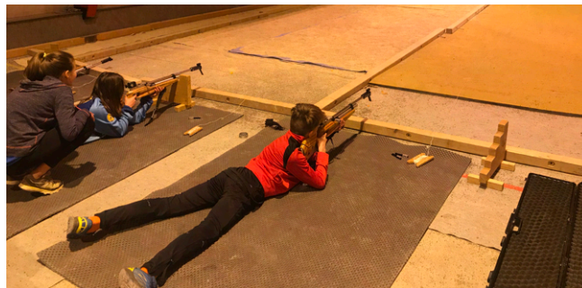
Entraînement de biathlon pour les jeunes du club