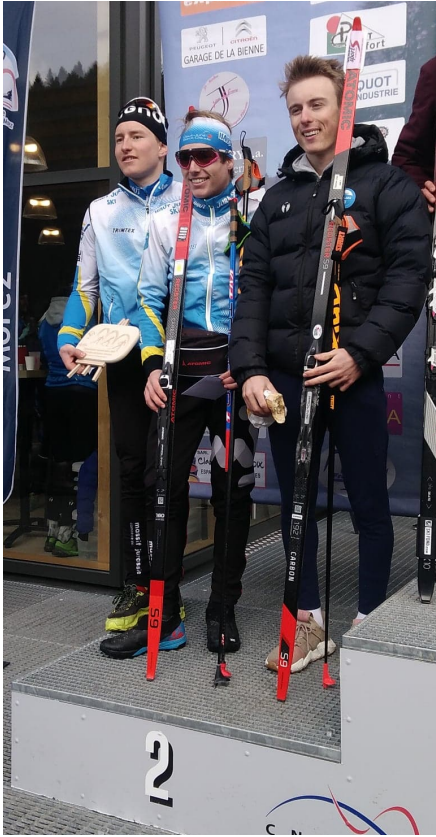
Relais U20/séniors 2ème du cht régional de relais