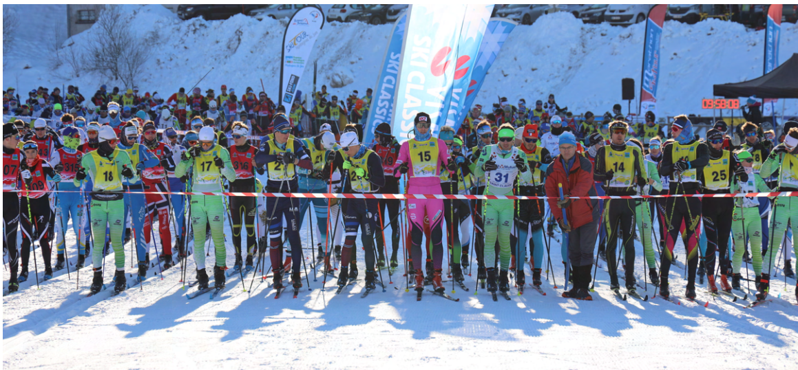
Départ des Belles Combes