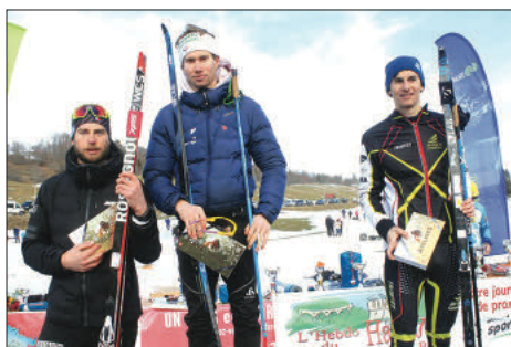
Podium scratch Hommes U20 / Senior