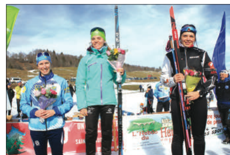
Podium scratch Dames U20 / Senior

Dimanche 16 février avait lieu à la Simard (Septmoncel-Les Molunes), comme chaque année le challenge Luc Vuillet, organisé par l'entente Sportive de Septmoncel, l'Association Sport et Neige de Lamoura et Haut Jura Ski.